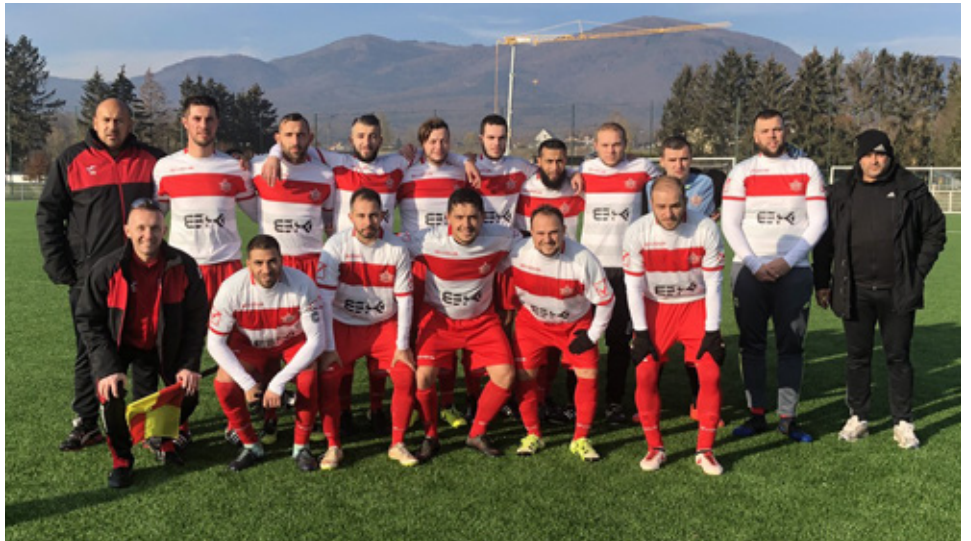
Initié en seniors, le FC Cernay Entente regroupe cette saison les seniors des Franco-Portugais et des SR Cernay, les prémices d'une fusion annoncée.