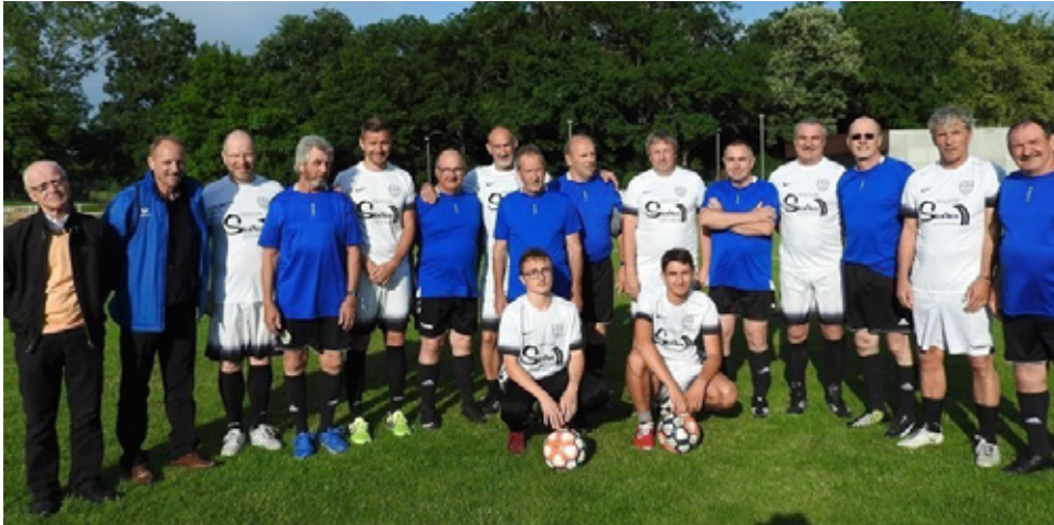
Pionnier en la matière, le SC Ebersheim s'est lancé dans l'aventure du foot en marchant la saison dernière.

Consciente de l'évolution de la pratique footballistique et soucieuse de proposer une offre de pratiques adaptée aux attentes des licenciés, la Fédération Française de Football est à l'initiative d'un nouveau plan de développement du Football Loisir. Orienté autour de cinq nouvelles formes de pratiques et la création de sections loisirs dans les clubs, ce dispositif sera décliné en Alsace sous différentes formes dès la phase printemps. Explications.