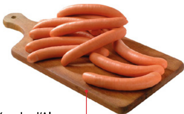
Knacks d'Alsace Tarif partenaire 6,70€ le kilo