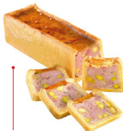
Mini Pâté Croûte Cocktail Pistaches Tarif partenaire 7,90€ la pièce de 600gr