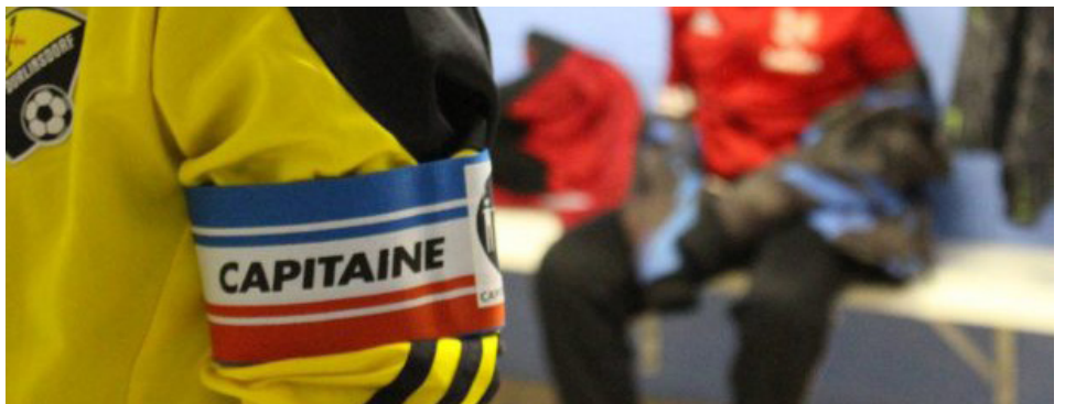
Ouvertes désormais aux catégories U13/U15 et U18, garçons comme filles, les formations des capitaines permettront aux clubs d'inscrire des points au classement fair-play.

Essence même du challenge J'AI RÊVÉ LE FOOT dans sa genèse, le classement du fair-play a été conservé et permettra en fin de saison à un club, d'obtenir un prix doté en matériel. « Ce classement s'appuiera sur l'analyse d'actions menées tout au long de la saison en lien avec l'idée fondamentale du challenge initial. Un système de points, établi par un barème qui sera présenté aux clubs