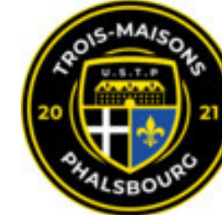
TROIS MAISONS/PHALSBOURG U.S.