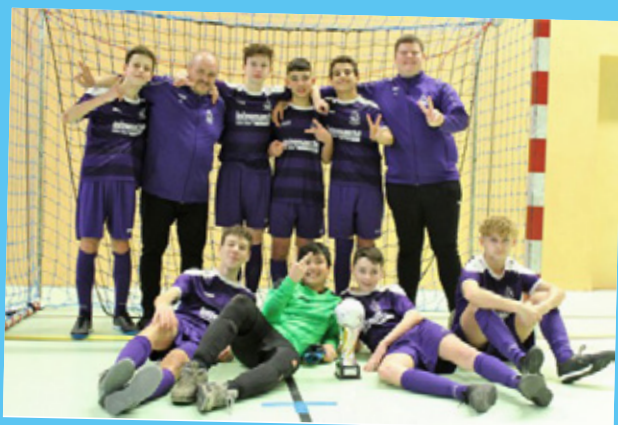
Coupe U15 : SC Sélestat 23 février 2020 à Cernay