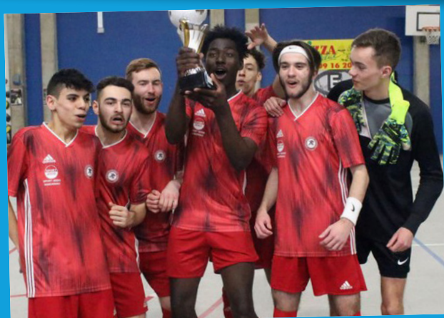
Critérium U18 : Entente Kaltenhouse/Marienthal 23 février 2020 à Kunheim