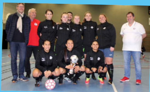
Critérium seniors F : Pfastatt futsal 23 février 2020 à Rosheim