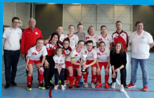
Critérium U18F : FC Vendenheim 23 février 2020 à Rosheim