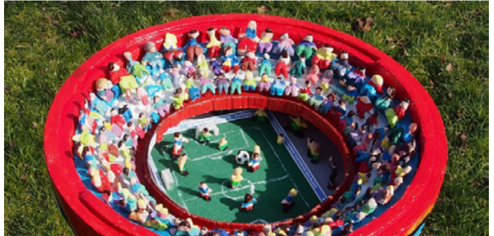
Grâce à leur stade miniature, les élèves de la classe multi-niveaux CM1-CM2 d'Emmanuelle Fleurette-Meyer de Soultzmatt ont décroché le prix national en 2018.

Ouverte aux classes de cycle 2 (CE1-CE2), de cycle 3 (CM1-CM2) d'écoles publiques et privées sous contrat, cette opération se décline en deux volets, l'un sportif, l'autre éducatif. « Le projet sportif consiste à réaliser un cycle de football ou de futsal de 6 à 10 séances au sein de la classe sur l'année scolaire, » indique Laure Clavé. Encouragés à se rapprocher du club de leur commune pour mutualiser les compétences et le matériel, les professeurs des écoles alsaciens souhaitant inscrire leurs classes dans ce dispositif ont aussi la possibilité de participer à des animations pédago-