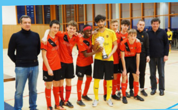
Coupe U18 : FCSR Obernai 23 février 2020 à Niederhausbergen