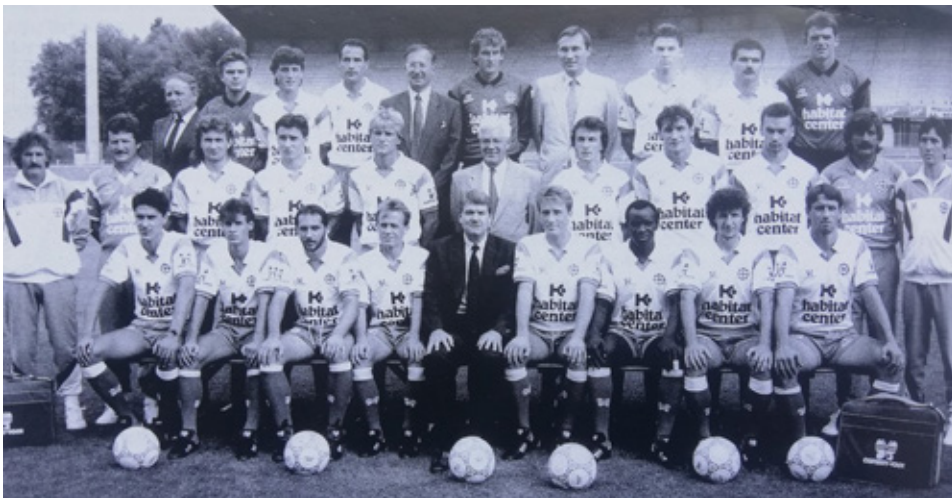
Les années 80, la décade mulhousienne, ici l'équipe vice-championne de France de D2 en 88/89 (photo 100 de football en Alsace).