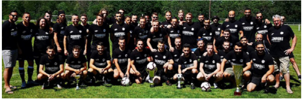
Les trois équipes seniors championnes cette saison, District 2 groupe F + Champion d'Alsace, District 6 groupe G + champion d'Alsace, District 8 groupe R.