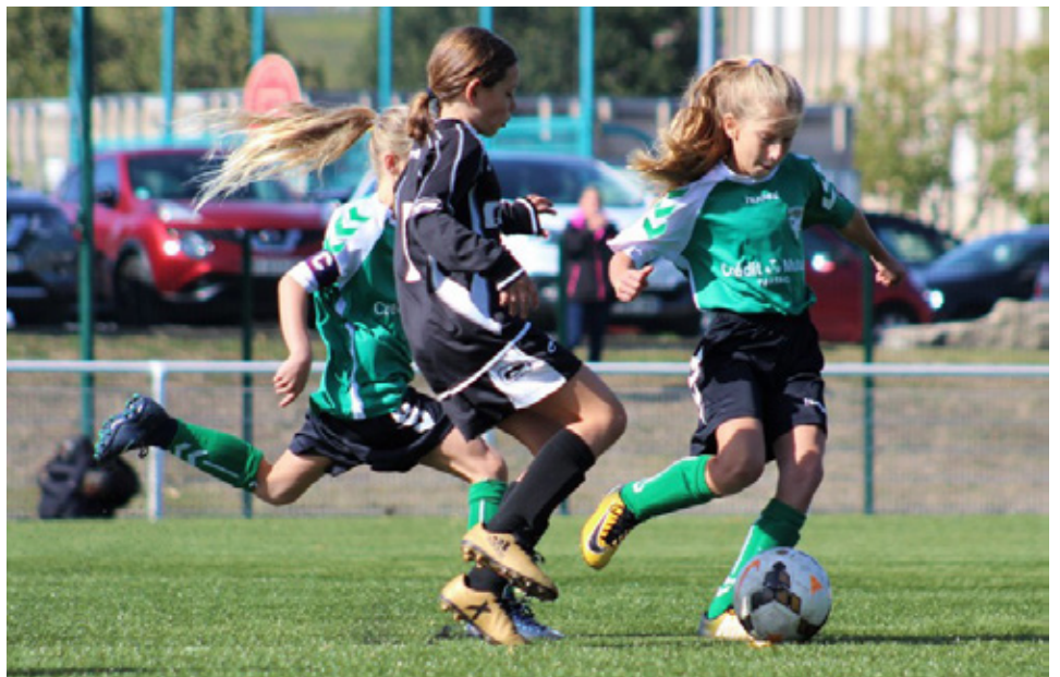
Au tour de 185 000 la saison dernière, les pratiquantes féminines devraient dépasser la barre symbolique de 200 000 licenciées cette saison en France grâce aux répercussions de la coupe de Monde féminine.

C'est indiscutable. Il y aura un avant et un après Mondial 2019. Malgré la déception légitime de n'avoir pas vu les filles de Corinne Diacre soulever la couronne mondiale à l'occasion de cette coupe du Monde organisée à la maison, la France du football peut se réjouir de l'incroyable engouement généré autour de cette 8e coupe du Monde féminine de l'histoire, remporté le 7 juillet dernier par les Américaines. Il n'y a qu'à se pencher quelques instants sur ses retombées médiatiques et économiques pour comprendre qu'en l'espace d'un mois, le football féminin, dans l'Hexagone, est passé dans une autre dimension. Entre 10 et 12 millions de téléspectateurs, en moyenne, se sont massés devant leur petit écran pour suivre les exploits d'Amandine Henry, de Kadidiatou Diani, de Wendy Renard et de leurs coéquipières. Un jackpot pour TF1 d'ailleurs, qui a largement rentabilisé en espaces publicitaires les 10 millions d'euros déboursés pour s'offrir les droits de cette compétition. Si elles ont échoué dans leur quête de titre mondial, les Bleues ont eu le mérite de s'immiscer dans les foyers et dans les têtes de millions de Français. En dehors de la déception liée son élimination face aux USA en quart de finale, l'équipe de France féminine peut