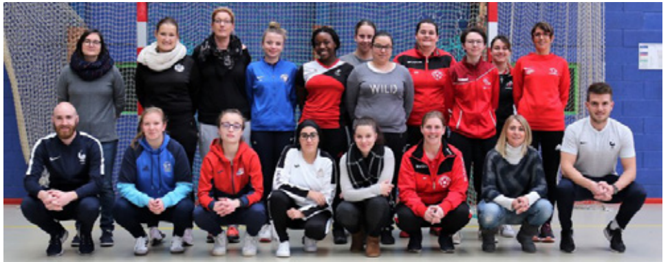
Mis en place en février 2018, le module Animatrice Fédérale sera reconduit cette saison en Alsace afin d'encourager les femmes à prendre en charge des équipes.