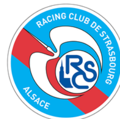
RC STRASBOURG ALSACE