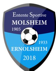
ES MOLSHHEIM ERNOLSHEIM