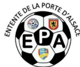
ENTENTE DE LA PORTE D'ALSACE