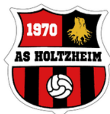
ENT. HOLTZHEIM/ BREUSCHWICKER.