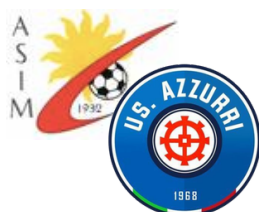
ENT. ASIM/ AZZURRI