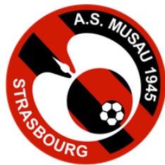
AS MUSAU STRASBOURG