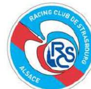
STRASBOURG RCSA 1