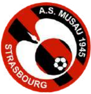
AS MUSAU STRASBOURG