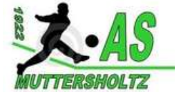
ENTENTE MUTTERSOLTZ MUSSIG