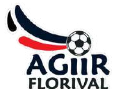
AGIIR FLORIVAL 1