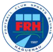
FR HAGUENAU 3