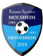
ES MOLSHHEIM ERNOLSHEIM 1