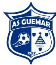
ENTENTE GUÉMAR SÉLESTAT