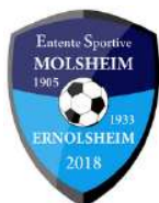
ES MOLSHHEIM ERNOLSHEIM 2