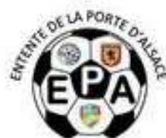
DANNEMARIE EPA 1