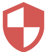
Tableau de bord sécurisé