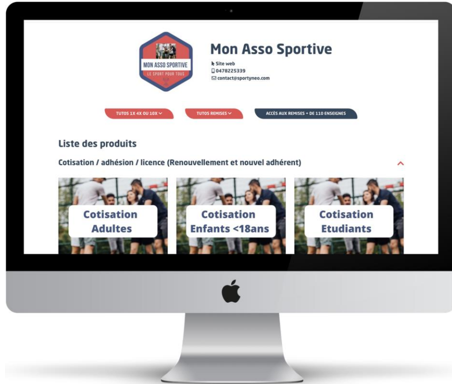
TABLEAU DE BORD / CÔTÉ CLUB