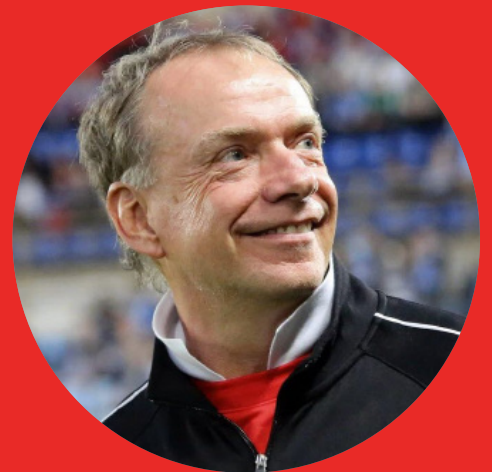
Notre tête de liste

« Très tôt, le football m'a construit puis épanoui. Une fois entraîneur et professeur, je n'aurai de cesse de transmettre les valeurs véhiculées par le sport en général et le football en particulier, véritables poutres porteuses sur lesquelles reposent la confiance en soi et en les autres. L'art le plus noble, disait Barnum est de rendre heureux ! Et dans le cirque actuel, cette noblesse est plus que jamais d'actualité. »